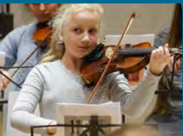
På Musikskolen lærer de unge at indgå i forpligtende sammenhænge.