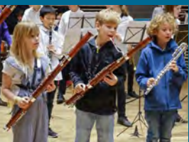
Et band eller et orkester er den ultimative skoling i samarbejde.